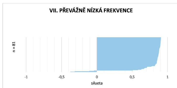
Obrázek 52 Silueta – převážně nízká frekvence (vlastní zpracování).

Závěrečným typem obcí byly obce s převážně nízkou frekvencí VLD. Byly typické téměř výhradní obsluhovaností nízkou frekvencí (80 %). 20 % obyvatel se nacházelo mimo dosah VLD. Pevážně se jednalo o obce Olomouckého kraje (66 z 385). Celkový počet obcí v typu byl 84 . Podíl obyvatel v typu činil 5 % zájmového území (Tabulka 23). Z pohledu homogenity se jednalo o značně konzistentní typ obcí (Obrázek 52). Průměrná hodnota siluety činila 0,92.