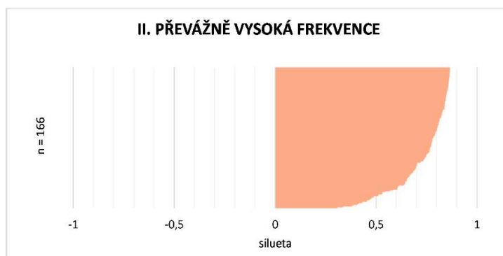
Obrázek 37 Silueta typu převážně vysoká frekvence (vlastní zpracování).

Další kategorií byly obce s převážně vysokou frekvencí. Obce se vyznačovaly významným podílem obyvatel v kategorii vysoké frekvence (75 %). Velmi vysoká frekvence v těchto městech absentuje, střední a nízká frekvence byla zastoupena jen ve velmi malé míře (celkem 5 %). Podíl obyvatel mimo dosah VLD byl 20 %. Z pohledu homogenity se jednalo o poměrně konzistentní skupinu obcí (průměrná silueta = 0,82) bez odlehlých pozorování (Obrázek 37). Celkem se v ní naházelo 166 z 631 obcí (Tabulka 18), jednalo se tedy o nejpočetnější skupinu (současně se skupinou V, která měla rovněž 166 obcí). Z toho v Moravskoslezském kraji 67 z 246 obcí (27,24 %) a v Olomouckém kraji 99 z 385 obcí (25,71 %). Lze tedy říct, že v rámci zájmového území do této kategorie spadá přibližně jedna čtvrtina obcí a zároveň jedna čtvrtina počtu obyvatel (u Moravskoslezského kraje pouze 20 %). Z prostorového hlediska lze konstatovat, že obce tohoto typu měly tendenci sousedit s obcemi I. typu, které jim tvořily spádová centra, resp. spádovými centry byla velká města s MHD, která nejsou součástí práce. Dále bylo možné zpozorovat tendenci výskytu okolo silnic vyšších tříd.